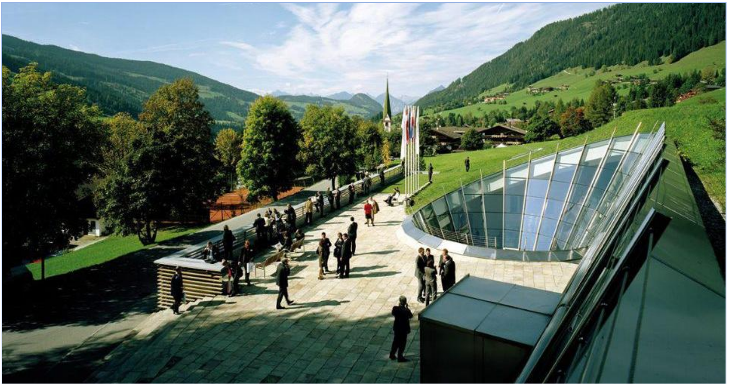
Selo Alpach u austrijskoj pokrajini Tirol - konferencijski kompleks – 90% površine ukopano u brdo