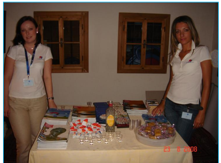
„Film-Workshop“ - predstavljanje Hrvatske uz domaće poslastice kao uvod u večer uz film „Što je muškarac bez brkova“ te razgovor s redateljem Hrvojem Hribarom