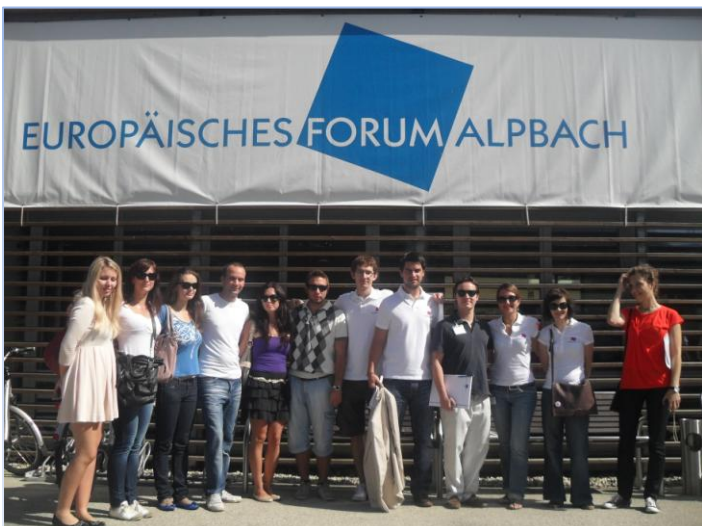
EFA 2011: dio hrvatskih stipendista - studenti i „mladi profesionalci“ iz područja prava, književnosti, ekonomije, medicine, elektrotehnike i računarstva, politologije, europskih studija, turizma...