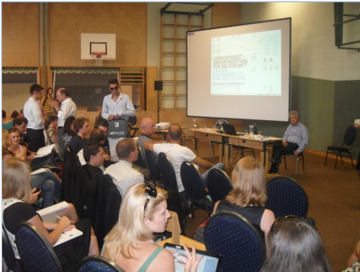
EFA 2011: detalj iz seminara „Global Justice“