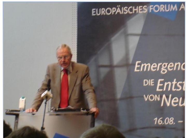
Izlaganje James M. Buchanana, dobitnika Nobelove nagrade za političku ekonomiju