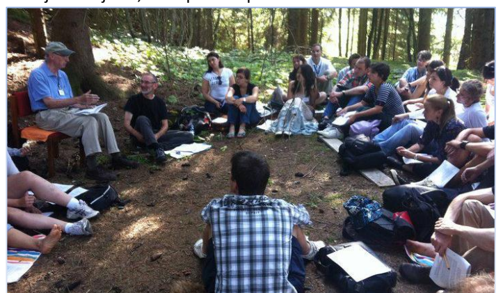
Seminari se povremeno održavaju i u prirodi