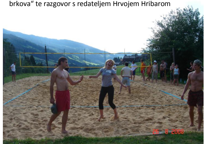
Sportske aktivnosti: planinarenje, odbojka, nogomet, tenis...