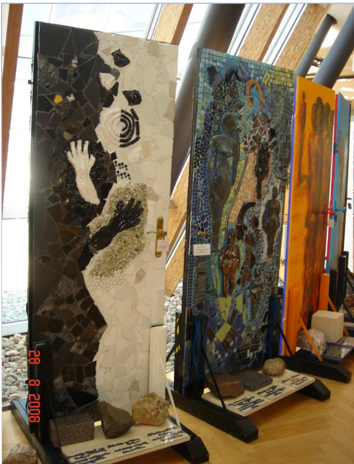
Tijekom EFA-e se održava bogat glazbeni i kulturni program