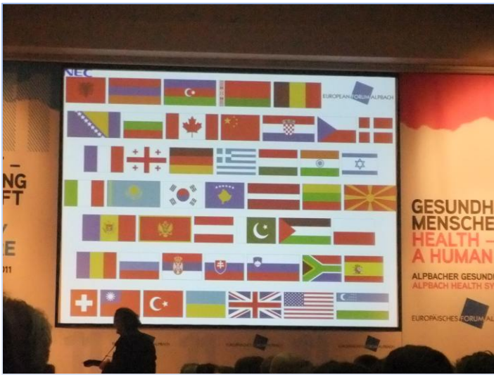
„International Evening“ - nakon Austrije, Hrvatska je 2011. s 36 sudionika imala najveći broj predstavnika u odnosu na ostale države