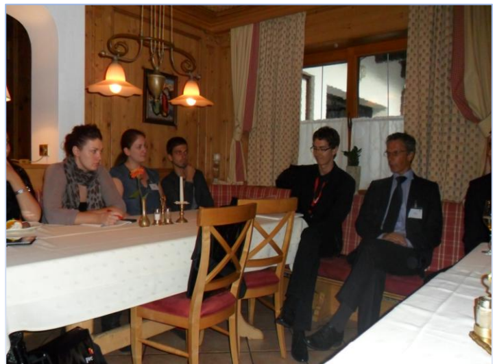
EFA 2011: „Fireside-Talk“ sa zamjenikom guvernera Hrvatske narodne banke dr. sc. Borisom Vujčićem