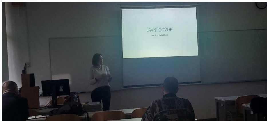
Slika 10. Doktorska škola seminar generičkih vještina