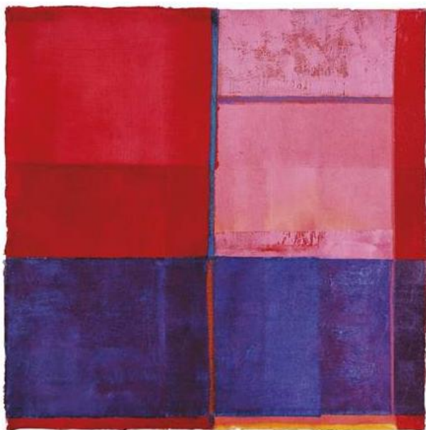
„UTOČIŠTE OSAME“ Koraljka Kovač, 2024.

TEMA: ISKUSTVO BOJA EXPERIENCE of COLOURS